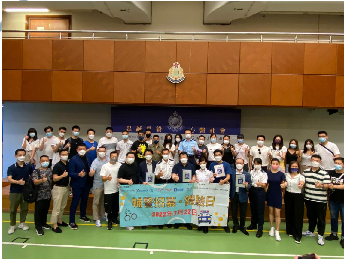
參加者與輔警教官合照