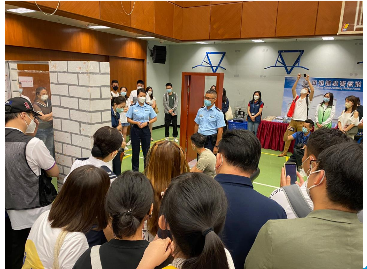
輔警教官展示訓練內容